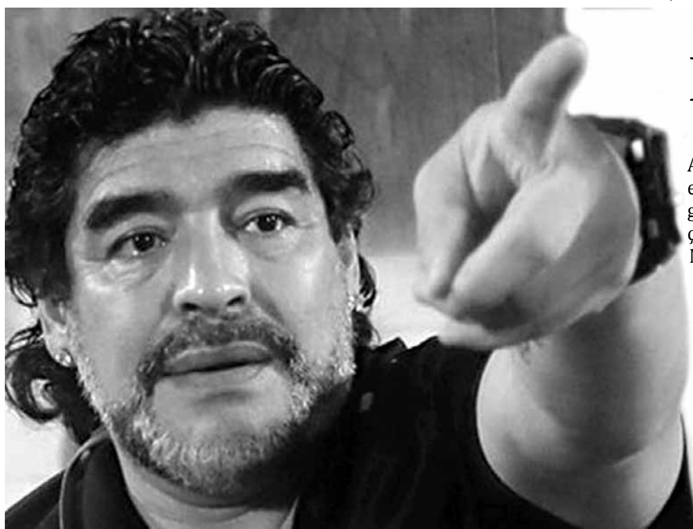
Maradona diz que Lionel Messi é bem melhor que Neymar e se considera bem superior a Pelé

Polêmico, como gosta de ser. Assim foi Diego Maradona em uma entrevista concedida ao diário argentino "Olé". Entre suas declarações mais picantes estão a de que Messi está acima de Neymar, assim como Maradona está de Pelé.