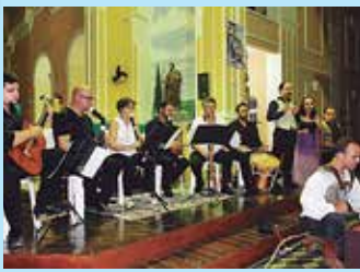
Iamaká se apresenta na UFPB amanhã