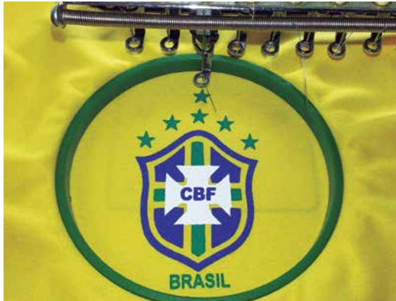
Simulação de aplicação industrial da estrela no uniforme