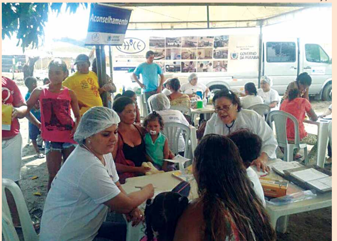
Comunidades recebem assistência médica, como consultas, vacinação, teste rápido de HIV, sífilis e hepatites B e C

Durante a ação, também houve a distribuição de folders informativos sobre as DST's e dengue e a entrega de três mil frascos de hipoclorito, produto que é colocado na água como forma de prevenção da dengue.