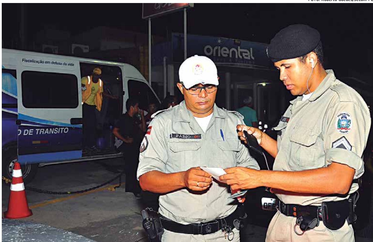
A Lei Seca estará na rua para evitar que os condutores de veículos dirijam embriagados durante os jogos e festejos juninos

O coordenador de comunicação garante que a Polícia Militar estará realizando abordagens a pessoas e veículos. "Pedimos a compreensão do cidadão caso seja abordado, pois esse trabalho é legal e necessário para a segurança pública", concluiu.