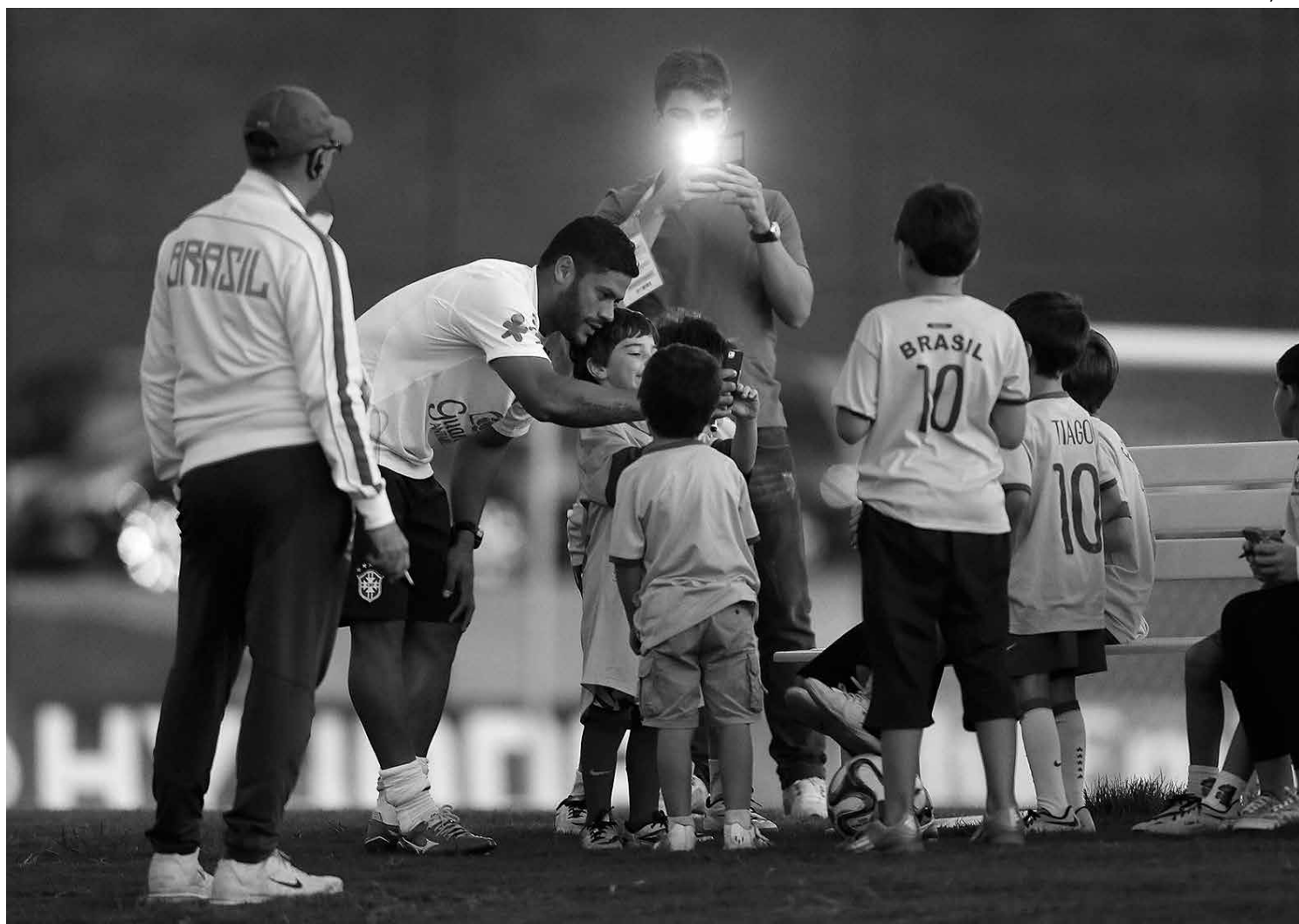
Hulk atende as crianças na Granja Comary. O atacante paraibano vem sendo um dos jogadores mais assediados nos treinamentos

Na semi, diante do Uruguai, Bernard entrou aos 18 minutos da etapa final e na decisão, contra a Espanha, Jadson o substituiu aos 27 minutos do segundo tempo.