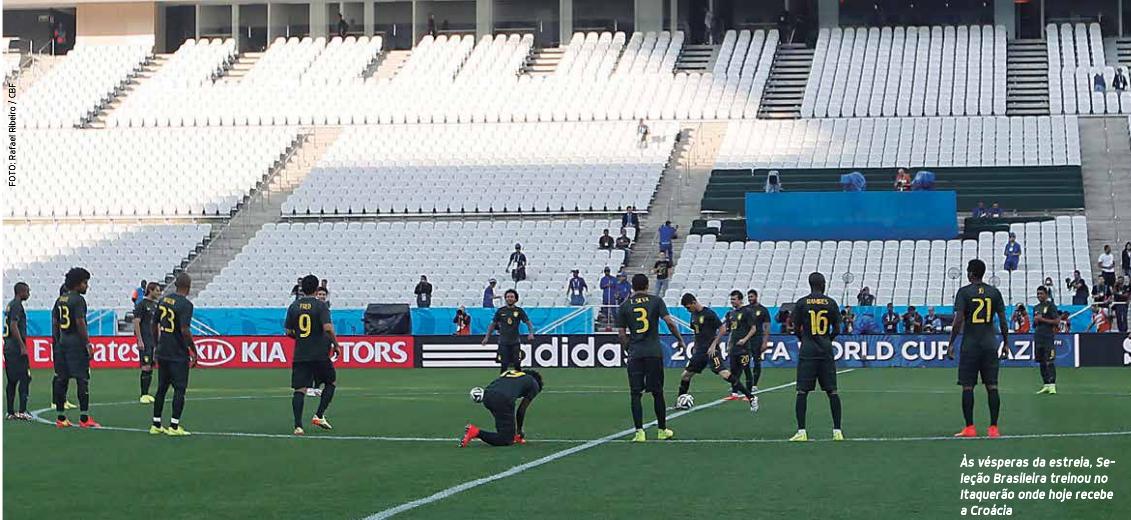
Às vésperas da estreia, Seleção Brasileira treinou no Itaquerão onde hoje recebe a Croácia