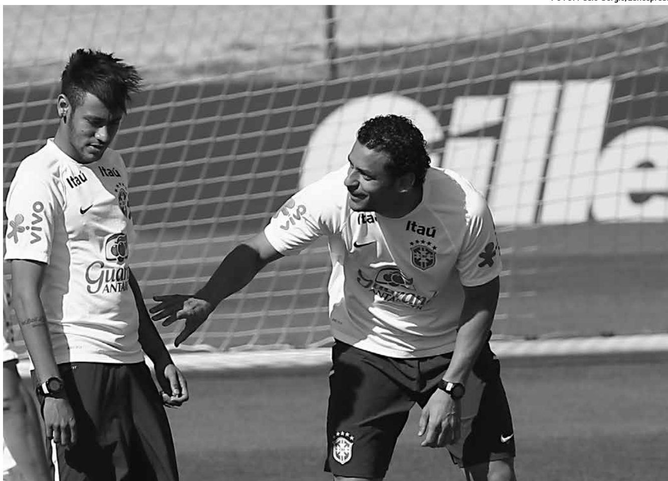
Neymar e Fred comandam o ataque da seleção que pode entrar para a história e superara a marca de outras grandes duplas

Ter goleadores eficientes, porém, não é garantia de título. O segundo ataque com maior número de gols, Ronaldo e Adriano com 89, fracassou em 2006, na Alemanha.