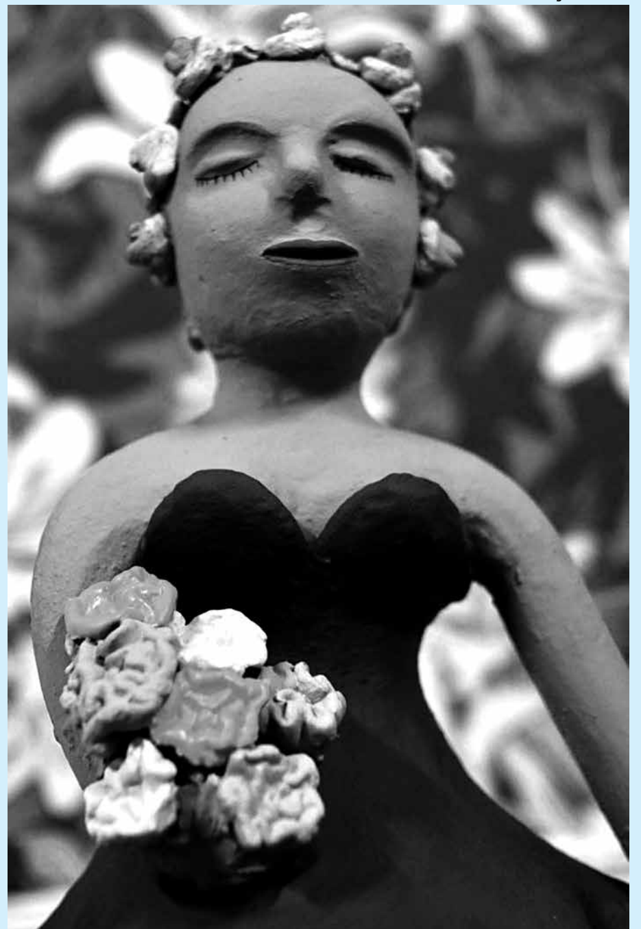
Projeto Brasil Original vai divulgar o trabalho dos artesãos durante a Copa do Mundo