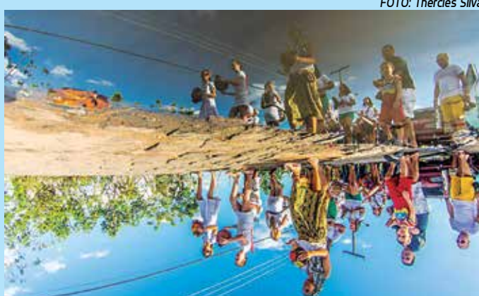
Click realizado durante o cortejo realizado durante o evento

À tarde, no pátio da Escola José Lins do Rego de Pilar, o assunto foi literatura e incen-